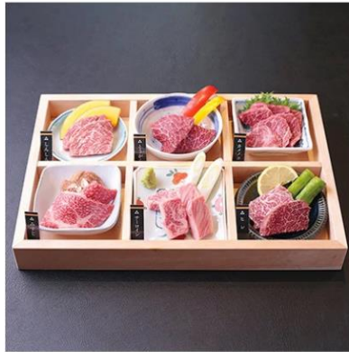
【佐賀牛 焼肉やました】ヘアお食事ご招待券 【佐賀県江北町】